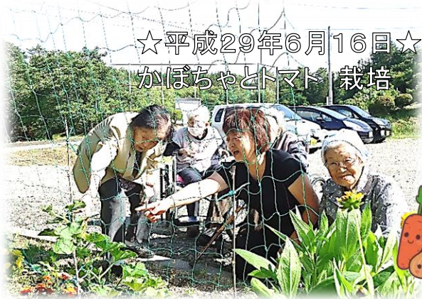
☆平成29年6月16日☆ かぼちゃとトマト 栽培

庭に植えたカボチャとトマトに肥しをあげました。収穫出来たら、おやつで食べるのを楽しみに育てています！