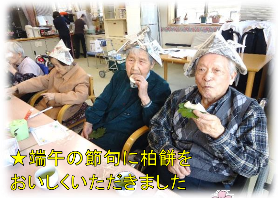
★端午の節句に柏餅をおいしくいただきました

沢石通所介護事業所は、地域密着型通所介護として住み慣れた地域で笑顔で楽しく生活が出来るようにお手伝いしています。毎日の運動やレクリエーション活動を中心に、季節の行事や地域の方々との交流など楽しく活動しています。