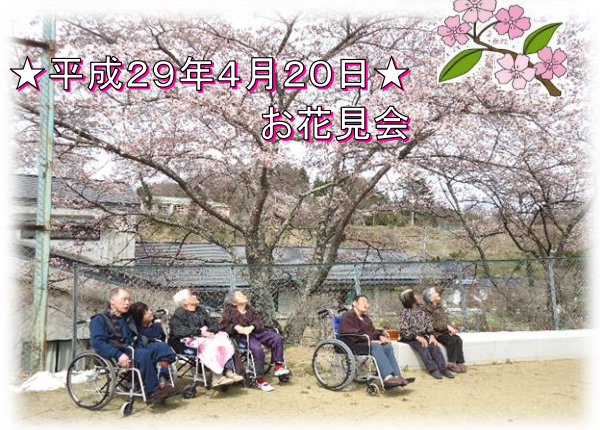
☆平成29年4月20日☆ お花見会

沢石福祉館では菖蒲湯など、昔ながらの季節行事を1年を通して行っており、春には運動を兼ねて沢石グランドへ行きお花見会を行いました。お茶にお饅頭を食べながら歌ったりと楽しく過ごしました。